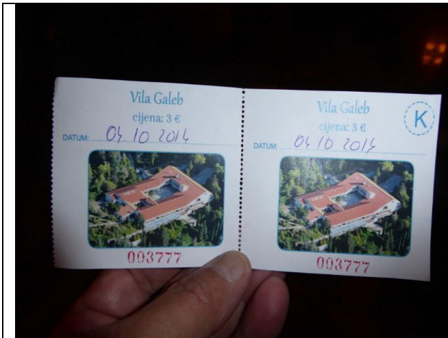
Pääsylippu Titon huvilaan